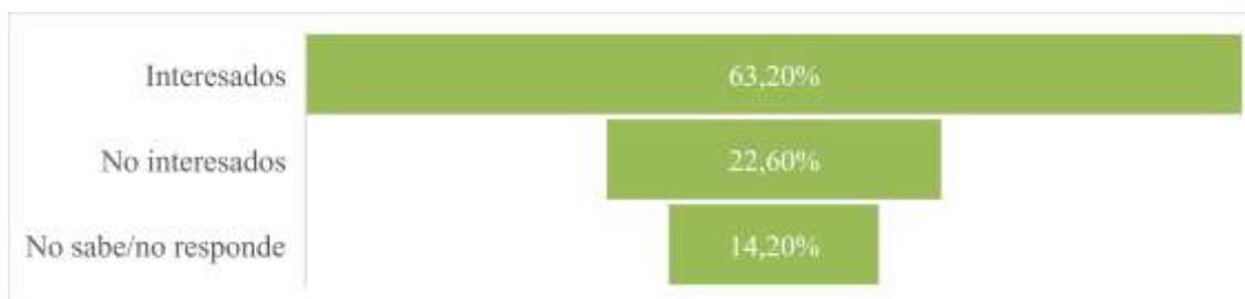
Figura 2. Interés en programas turísticos culturales dirigidos a la diáspora ecuatoriana

Nota, resultados en base a la encuesta realizada por los autores.